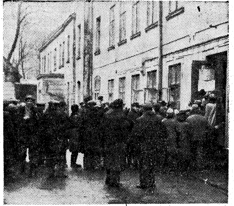
Dzisiaj mija termin składania podań o koncesje. Urzędy skarbowe załatwią dziś wszystkich zgłaszających się. — Przed „Zgromadzeniem Kupców m. Łodzi” stoi długa kolejka, ale Biuro do spraw koncesjonowania załatwi wszystkich, bo to ostatni dzień.

RZYM, 14. 11. (PAP). W Mediolanie i w okolicy doszło do nowych zejść. Ofiarą padł m. in. robotnik, który został ciężko ranny przez faszystowskich napastników.