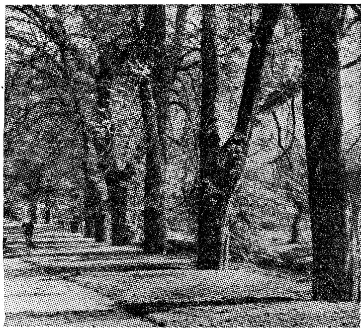
W alejach parku Poniatowskiego w Łodzi zaległa jesienna cisza.