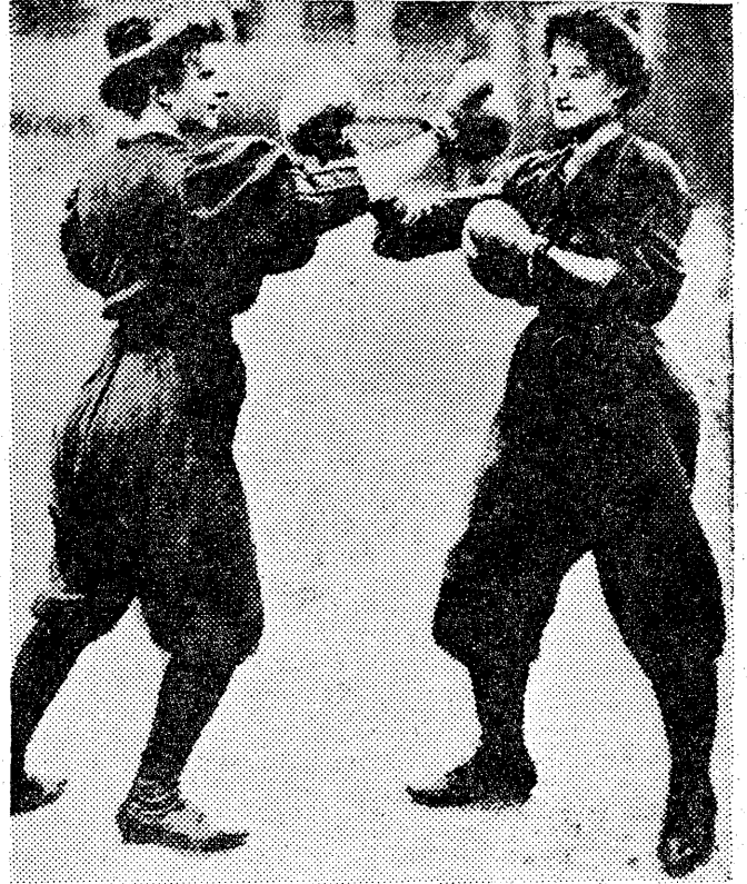
We Francji nawet pięć piękna uprawia sport piściarski.