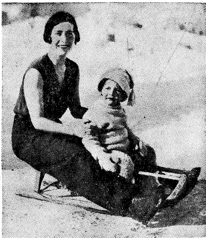
Tam, gdzie odbędzie się olimpiada zimowa — w St. Moritz panuje już zima.