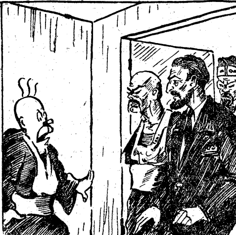
PARKER: Nie zdołał nam uciec. Trzeba się z nim radykalnie rozprawić. Ale jak to zrobić?