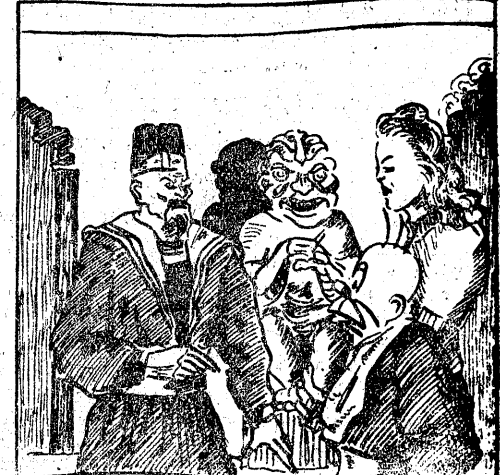
KAPLAN: Zostaniecie tu do jutra. Wkrótce spotka was najwyższe szczęście w krainie cierni.