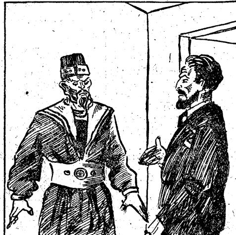
KAPLAN (do Parkera): Podaruj mi tych jeńców na ofiarę dla bóstwa.