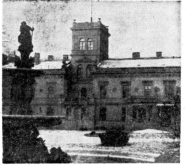
Przy Placu Zwycięstwa w Łodzi mieści się Politechnika Łódzka.