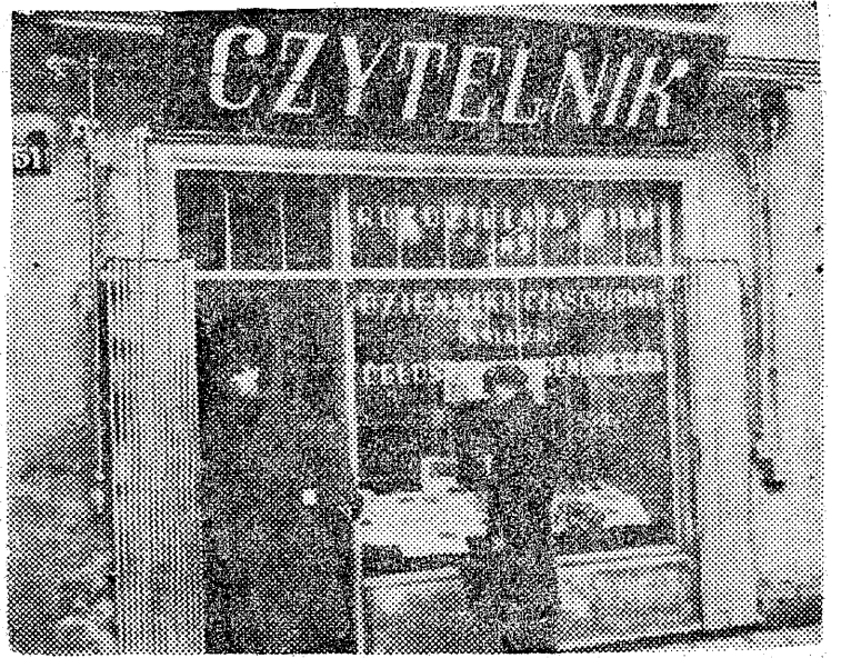
W Pabianicach otwarta została rozdzielnia dzienników, czasopism i książek „CZYTELNIKA”.

Na otwarcie łódzkiej konferencji „racjonalizatorów” przemysłu włókienniczego