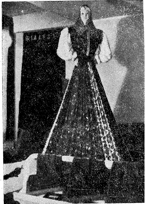
Fragm. stoiska pawilonu Przemysłu Tekstylnego na Międzynarodowych Targach Poznańskich