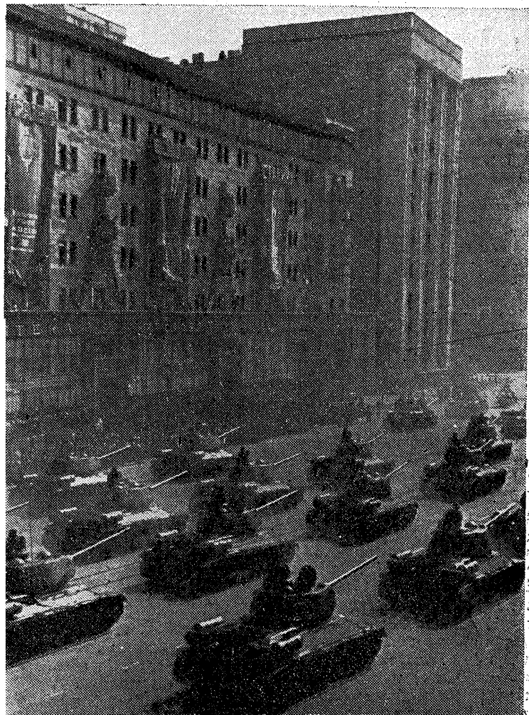
W dniu święta 1 Maja w Moskwie na Placu Czerwonym odbyła się imponująca defilada wojskowa.