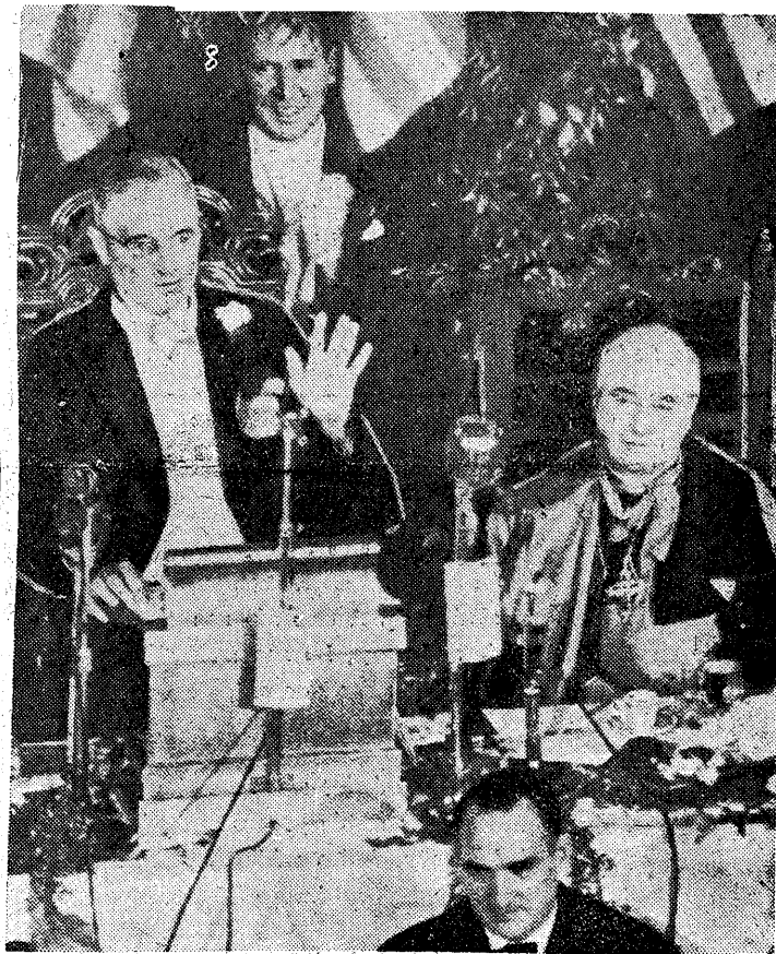
Prezydent Truman i kardynał Spellman, arcybiskup Nowego Jorku. Kardynał Spellman wymieniany jest ostatnio jako kandydat na stanowisko sekretarza stanu w Watykanie. Fotografia przedstawia fragment bankietu przyjaciół św. Patryka.