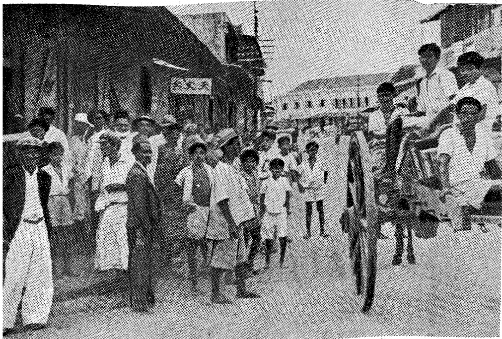
W chińskiej dzielnicy Port Louis na wyspie Mauritius spotkać można ludzi różnych kolorów skóry i rasy: Malgaszów, Hindusów, Chińczyków i Arabów. Klasę rządzącą stanowią biali, do których należy ziemia, przemysł i wielki handel. Wyspa Mauritius jest kolonią angielską. Leży ona w strefie zwrotnikowej na oceanie Indyjskim.