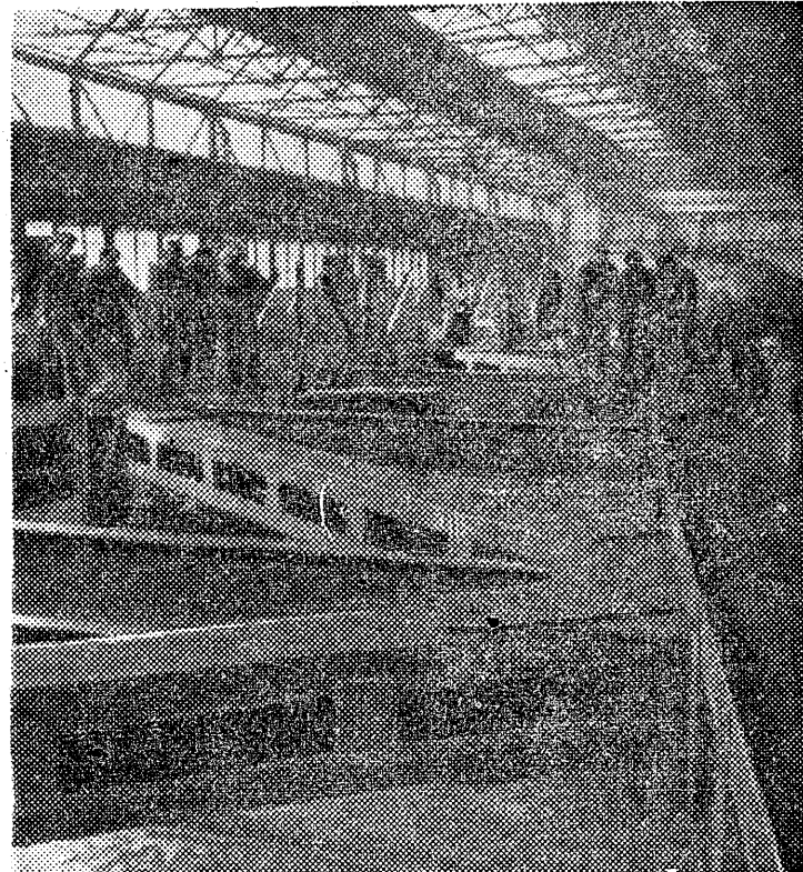
W hucie „Mostowagon“ w Ochozowie i w hucie „Zabrze“ wykończona ostatnie części mostu średnicowego dla Warszawy. Roboty te zostały wykonane na 2 miesiące przed terminem. Wysilek robotnika i inżyniera śląskiego umożliwił wcześniejsze przystąpienie do robót przy konstrukcji mostu śląsko-dąbrowskiego. — Na zdjęciu fragment ostatniego przęsła mostu średnicowego.

Wiele dzienników wydało wczoraj dodatki nadzwyczajne. Cała prasa pisze z wdzięcznością o zgodzie ZSRR na zmniejszenie reparacji.