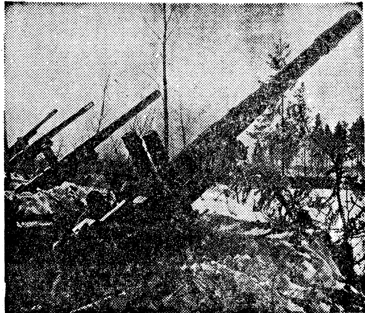
22 czerwca 1941 roku armie hitlerowskie napadły na Związek Radziecki. — Do zwycięstwa nad Niemcami przyczyniła się w dużej mierze świetna artyleria sowiecka.