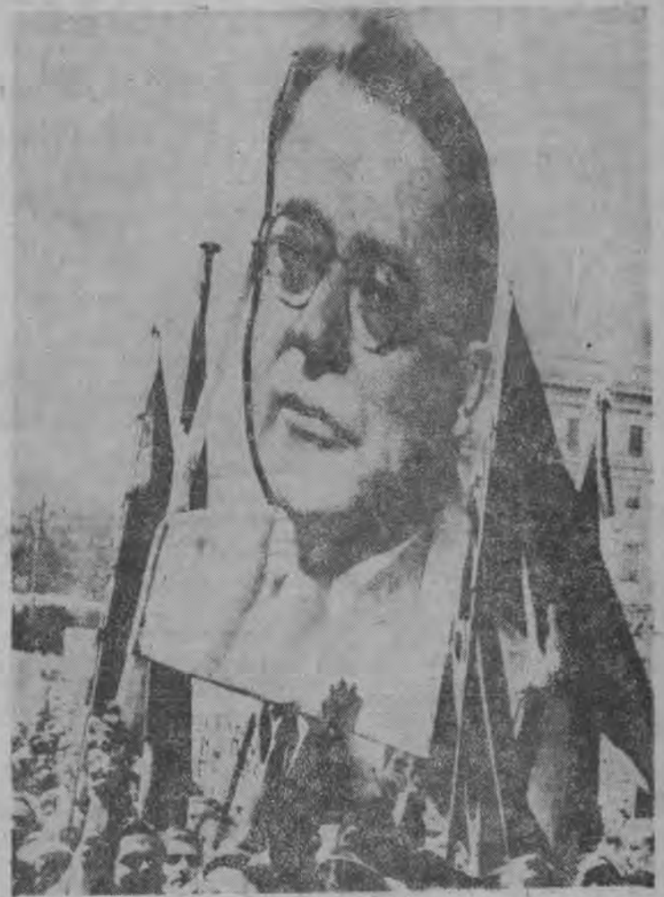
Manifestacje we Włoszech z okazji powrotu do zdrowia Palmiro Togliatti.

General Pierre Koenig, gubernator francuski w Niemczech, wystosował depeszę do wszystkich, którzy pozostali przy życiu, składając wyrazy ubolewania z powodu straszliwego nieszczęścia.