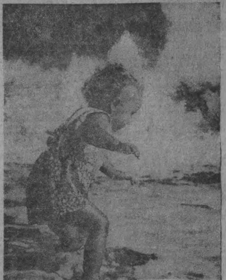
Jeden z najmłodszych młodszyńców morza

Brytyjskie koła gospodarcze wyrażają powątpiewanie, czy St. Zjedn. sfinansują więc kredyty 5 miliardów dolarów przynane na pierwszy rok realizacji planu Marshalla.