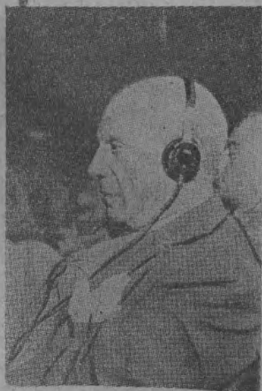
Pablo Picasso, najwybitniejszy malarz współczesny, wygłosił płomienną mowę w obronie swojego przyjaciela, poety Pablo Neruda, prześladowanego przez faszyzm i ukrywającego się przed zbirami chilijskiego rządu. Po mowie Picassa uczestnicy Kongresu urządzili entuzjastyczną owację. — We Wrocławiu pokazano Wystawę plastyki francuskiej. Wśród eksponatów znajdowały się również płótna Picassa.