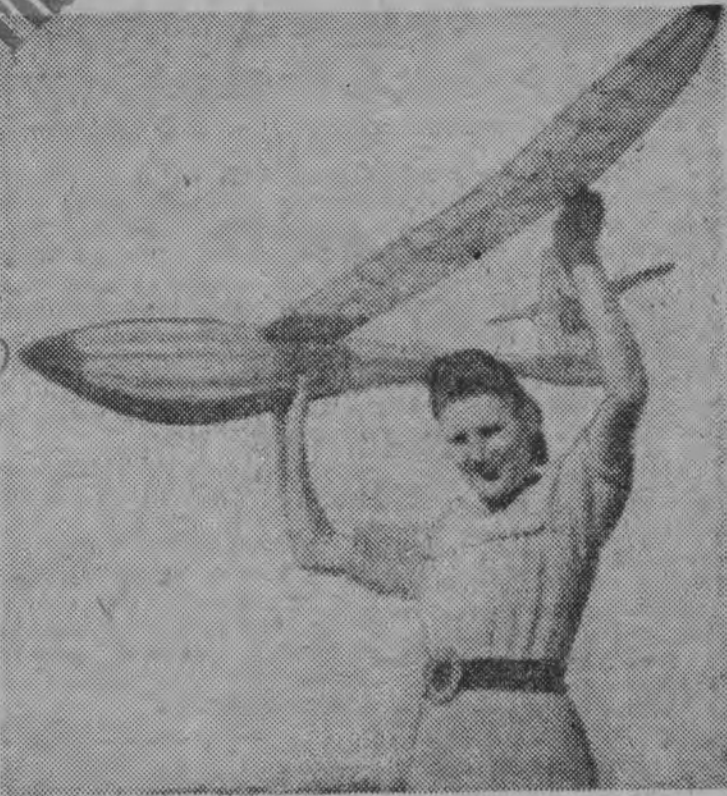
Młodzi entuzjaści lotnictwa rozpoczynają swe szkolenie teoretyczne od wykonywania modeli. — Zdjęcie przedstawia model szybowca.

WARSZAWA, 4.9. (PAP). Rozpoczął się 3 z kolei turnus brigady „Służby Polsce“, w którym udział weźmie przede wszystkim młodzież wiejska. Uczestniczącego turnusu zatrudnieni na terenie Warszawy pracować będą nadal przy trasie W—Z na odcinkach Leszno—Młynarska, przy ul. Zygmuntowskiej oraz przy budowie Centralnego Domu Młodzieży Polskiej.