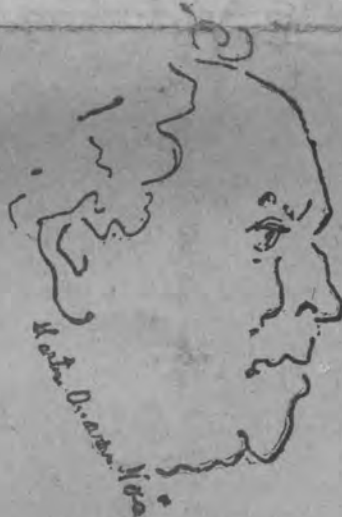
Martin Andersen Nexoe, Danis. Jego powieści przetłumaczone są na wszystkie języki i rozchodzą się w olbrzymich nakładach.