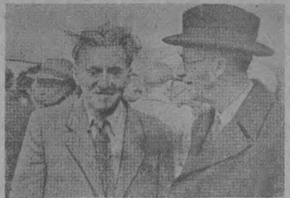
Na Wrocławskim Kongresie Intelektualistów spotkały się znakomości całego świata. Na zdjęciu widzimy Iję Erenburga (z lewej) w rozmowie z Julianem Huxleyem.