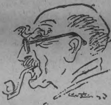
J. B. Haldane, profesor biochemii, W. Brytania.