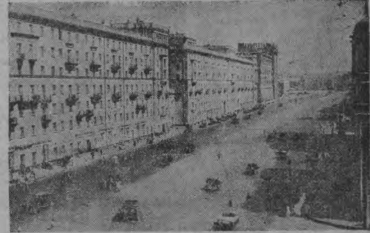
Ulica Sadowa w Moskwie w końcu dziewiętnastego stulecia (zdjęcie u góry) i ta sama ulica dzisiaj (zdjęcie u dołu).