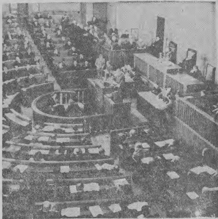
Widok ogólny sali sejmowej podczas odbywającej się obecnie sesji Sejmu Ustawodawczego.