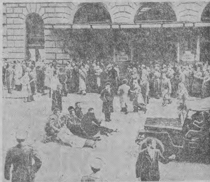
Podczas ostatnich strajków w Rzymie włoscy robotnicy demonstrowali blokując w ten sposób auta policji