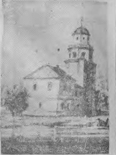
O godz. 1.30 przyjechałem ze Złoczewa do Wielunia, który zastałem również w śnieżnej szacie. Z północy wiał przejmujący wiatr.

Z rozmów ze znanymi obywatelami Wielunia wynika, że w mieście z 13-tysięczną ludnością nie ma łaźni. Z roku na rok miasto odkłada tę inwestycję. Zaledwie co 15 wieluniańnin może pozwolić sobie na ciepłą kąpiel w domu. Tymczasem „centralna wylegarnia” stoi pustkami. Jeśli szkoła handlowa może mieścić się w baraku, to czemu tej wylegarni nie przekształcić w tymczasowy zakład kąpielowy z kilkoma natryskami i wannami. Wiadomo, że Wielu-