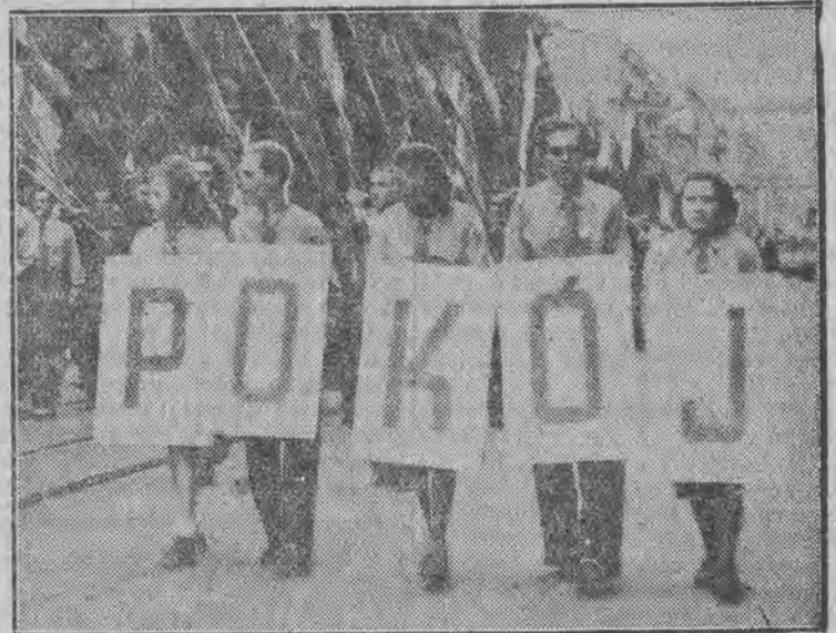
Hasło, które jednoczy setki milionów ludzi.

Zawodom przyglądało się 8 tysięcy widzów.