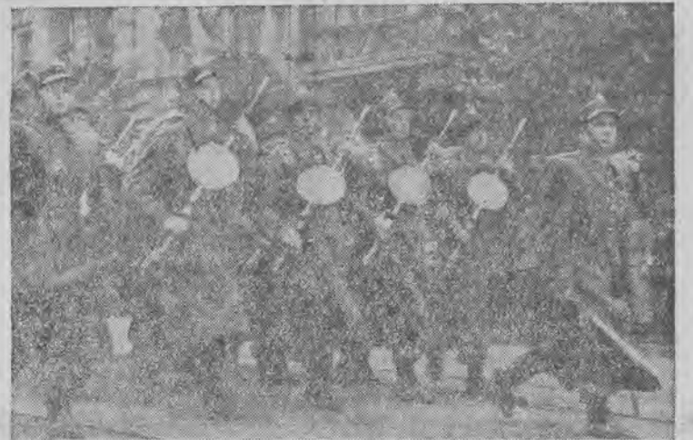
14 maja rb. mija 6 lat od chwili, gdy nad daleką Oką, w Związku Radzieckim zaczęła się formować I Dywizja im. T. Kościuszki.

W rocznicę powstania Dywizji, naród polski składa hołd i uznanie bohaterom spod Lenino.