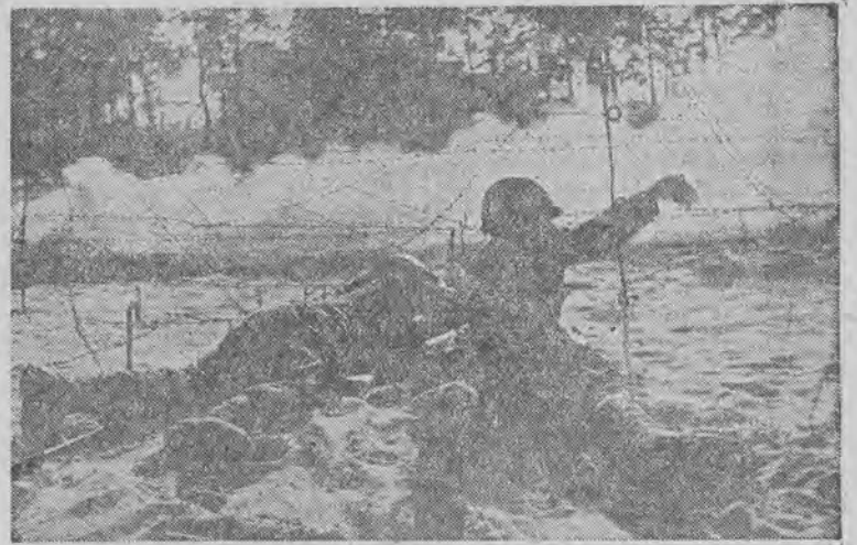
I Dywizja im. T. Kościuszki zasłużyła się w całej pełni dziełu wyzwolenia i odbudowy Polski Ludowej.

Na długim szlaku bojowym, od Lenino do Berlina, pełna poświęceń, odwagi i zapału, realizowała najszczytniejsze hasła walki z wrogiem. Krew jej, przelewana w walce przeciwko wspólnemu wrogowi Słowiańszczyzny u boku wielkiego sojusznika scementowała dożygoną przyjaźń i przymierze Polski ze Związkiem Radzieckim.