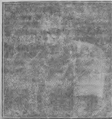
Leśkiewicz Jerzy (13 miejsce)