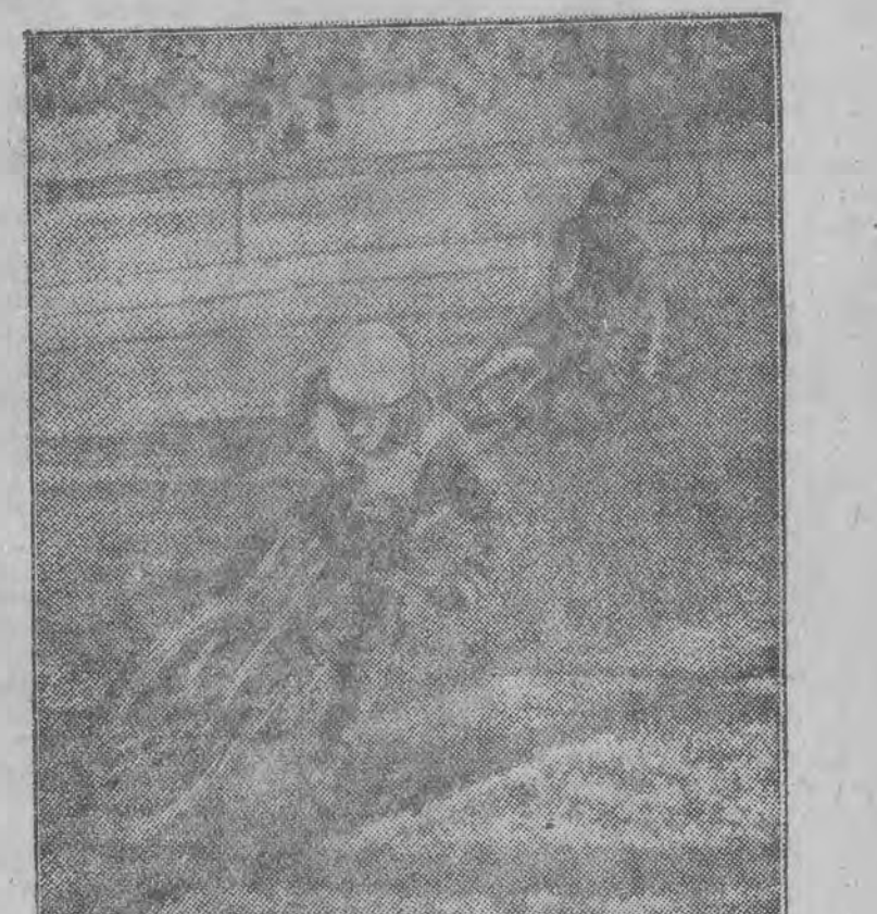
Zawody motocyklowe na żużlu cieszą się coraz większym powodzeniem

LONDYN, 26.6 (PAP). Agencja Reutersa donosi, że w niedzielę dokonano w Seulu, stolicy Korei południowej, zamachu na koreańskiego działacza politycznego Kim-Ku Zamachowiec który został aresztowany, oddał kilka strzałów rewolwerowych do Kim-Ku, który zmarł z odniesionych ran. Zamordowany Kim-Ku był przeciwnikiem obecnego prezydenta marionetkowego rządu Korei południowej (okupowanej przez USA). Ostatnio domagał się on nawiązania rozmów z demokratycznym rządem Korei północnej dla rozpatrzenia sprawy zjednoczenia Korei.