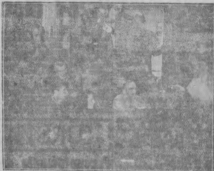
Film „Ulica Graniczna” cieszy się wielkim powodzeniem na ekranach polskich, radzieckich, czeskich, francuskich. Oto zdjęcie z realizacji tego filmu. Pośrodku reżyser Aleksander Ford (w koszuli).

ZJEDNOCZONE ZAKŁADY PRZEMYSŁU SUCHEJ DESTYLACJI DREWNA w ŁODZI