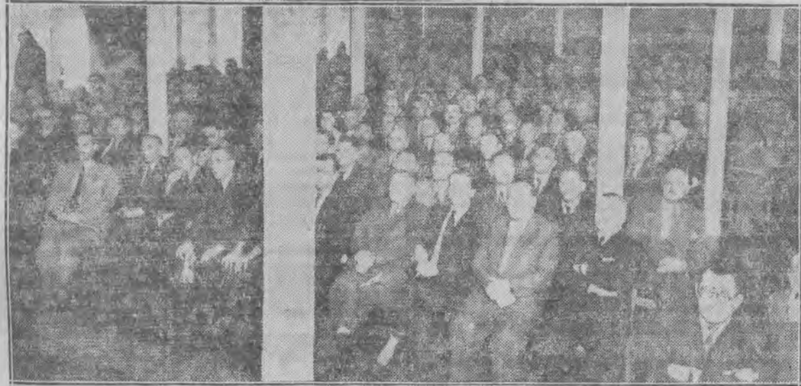
Zjazd rzemiosła woj. łódzkiego.