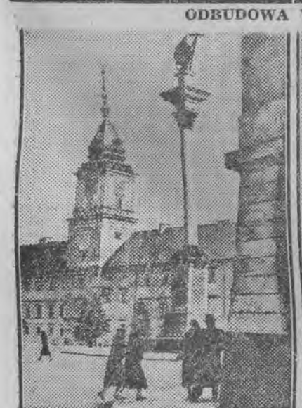
Tak wyglądał plac Zamkowy przed wojną...

Waszyngton 9. 8. — We wtorek wrócił samolotem do Waszyngtonu szefowie sztabu amerykańskiego, gen. Bradley, gen. Vandenberg i admirał Donfeld, którzy w ubiegłym tygodniu przeprowadzili inspekcję krajów marshallowskich. W środę szefowie sztabu amerykańskiego złożyli sprawozdanie na łącznym posiedzeniu komisji budżetowej i spr. zagranicznych o wynikach swej podróży.