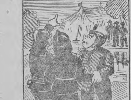
Basen w ogrodzie miasteczka cyrkowego był oteplony przez szpiclów, przebranych w mundur strażackie i policjunc. „Pożar” już ustał, Mgła zasłony dymnej żółcią bez śladu.