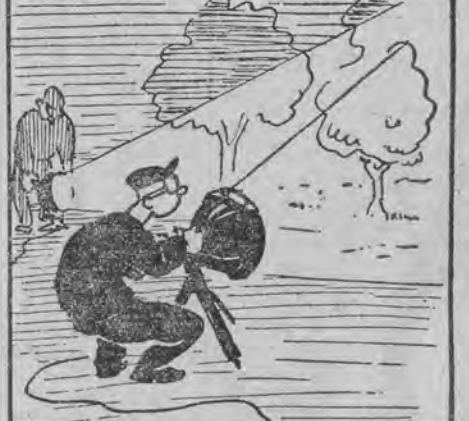
Było już daleko po 12, ale noc jasna i gwiazdzista. W dodatku zbudzona hałasem zaloga miasteczka cyrkowego uruchomiła reflektory elektryczne. Śmigły żółtego, zielonego i różowego światła.