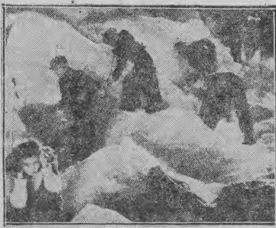
Z filmu „Złoty róg”

Akcja filmu rozgrywa się na tle malowniczego krajobrazu wysokogórskiego w Kazakstanie. Młody