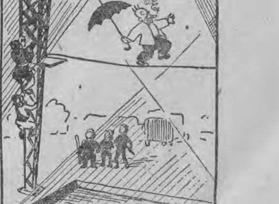
ła skierowały się w kierunku źródła hałasu. Po kilku sekundach strumienie światła skierowały się na wysokość sześciu metrów. W powietrzu, z parasolem w ręku, palące cygaro, spacerował Agapiet Krupka.