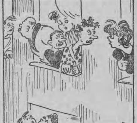
Wszystko to trwało tylko minuty. Zbudzeni ze snu cyrkowcy rzucili się do okien — styszac w ogrodzie miasteczka cyrkowego tupot ciężkich butów i krzyki — jakby kometę.