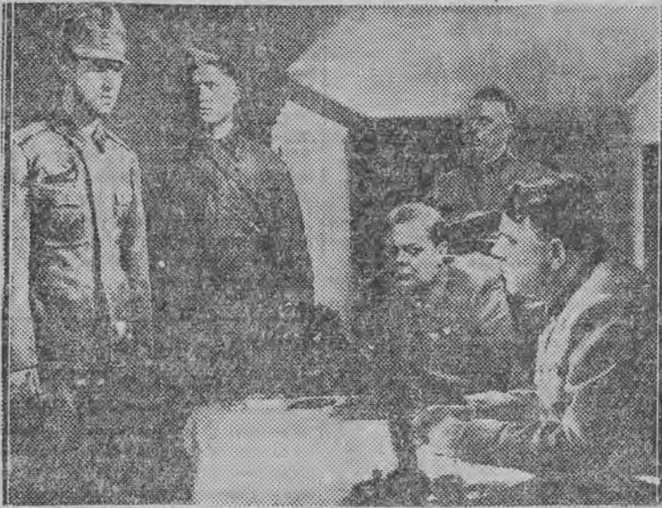
Scena z filmu „Bitwa o Stalingrad”, który ujrzymy w ramach odbywającego się festiwalu.