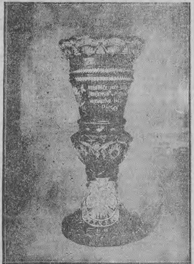
Foto — Śmigacz Wielki wazon kryształowy — dar robotników Huty Szklanej „Hortensja” w Piotrkowie