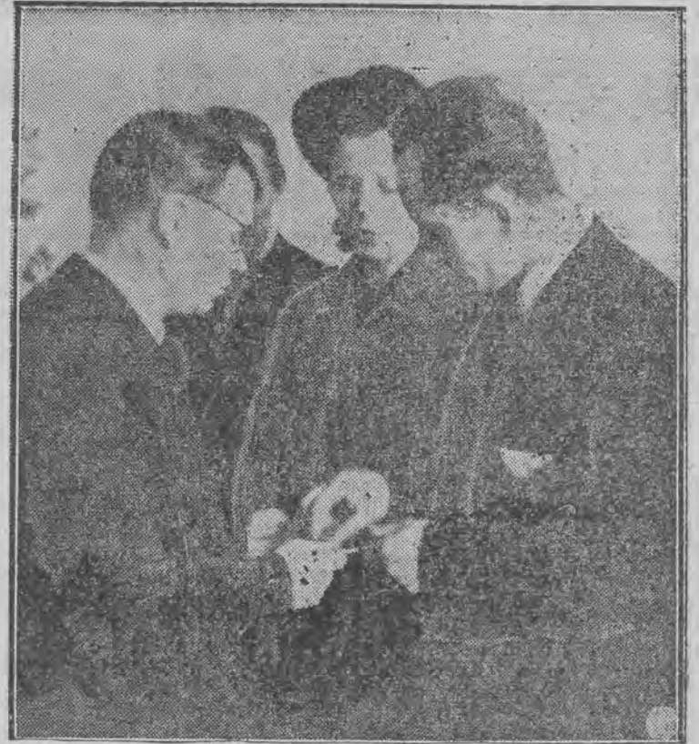
Moment zamiany obrączek jest w życiu młodej pary przełomową chwilą. (do art. na str. 3)