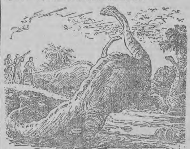
...Paleontolog wystrzelił w powietrze. Brontozaury zerwały się i wyciągnęły ogony, z podniesioną głową, zaczęły uciekać w kierunku wody...

(3) tym, co naruszyli ich poobiedni odpoczynek. Okazało się, że grzbiet ich sięga wyżej niż podniesiona ręka człowieka średniego wzrostu; długość ich — od głowy do końca ogona — wynosiła ze dwadzieścia metrów.