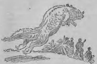
...Z zarośli wyskoczył nowy zwierzę... Pilot nasz, doświadczony strzelec, wyczekał aż się zwierzę przybliży i dopiero wtedy wystrzelił...