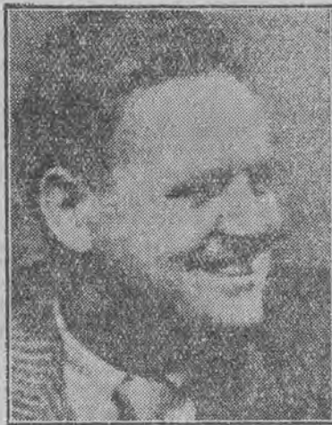
28 kwietnia 1950 roku — 50-lecie urodzin MAURICE THOREZA

Syn górnika, wnuk górnika, Maurice Thorez urodził się 28 kwietnia 1900 r. w Noyelles, małej osadzie