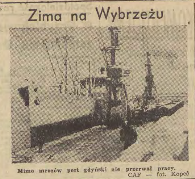
Mimo mrozów port gdyński nie przerwał pracy.