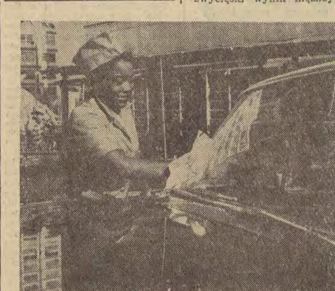
Wśród kierowców hawajskich taksówek można spotkać wiele kobiet.

PARYŻ (PAP). — Wojska ONZ panują nad sytuacją w Elisabethville, stolicy Katangi. Na północ od stolicy saperzy irlandzcy usiłują naprawić most na rzecze Lufira wysadzony w powietrze przez żandarmerię katangijską. Celem, do którego zmierzają obecnie oddziały ONZ są dwa miasta Jedotville i Kolwezi będące ośrod-