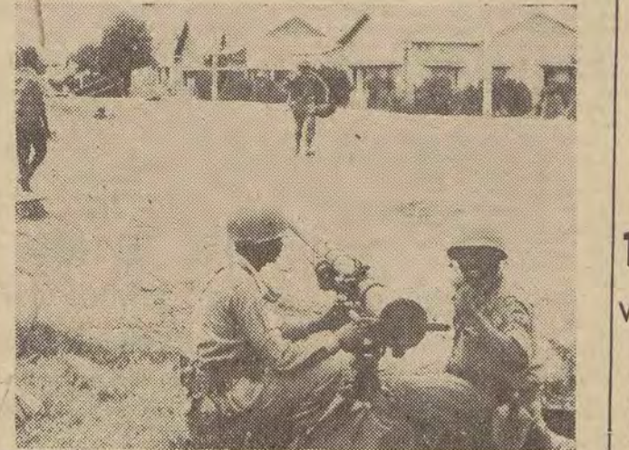
Etiopskie oddziały wchodzące w skład sił zbrojnych NZ kontrolują ulicę Elisabethville.

Przed stacją Baby na trasie Kozłuszki — Katowice stanął w płomieniach elektrowóz pociągu towarowego. Interwenowały dwie jednostki straży pożarnej. Zniszczeniu uległa instalacja elektrowozu. (fcl)