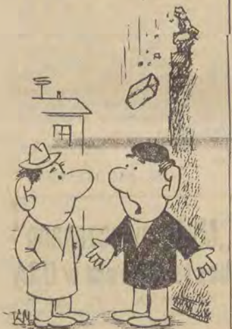
TAK WŁAŚCIWIE TO NIE WIADOMO O CZYM PISAC O TYCH CZERWONYCH SKRZYŃKACH...