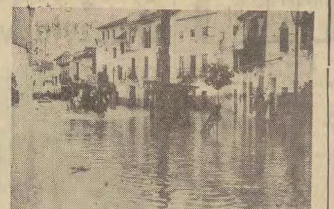
Obfite opady spowodowały ponownie poważne powódź w Andaluzji. Tysiące rodzin, które przetrwały poprzednią powódź, straciły obecnie dach nad głową. W Grenadzie i Sewilli wielu ludzi poniosło śmierć. NA ZDJĘCIU: ulica w Ecija (Sewilla).