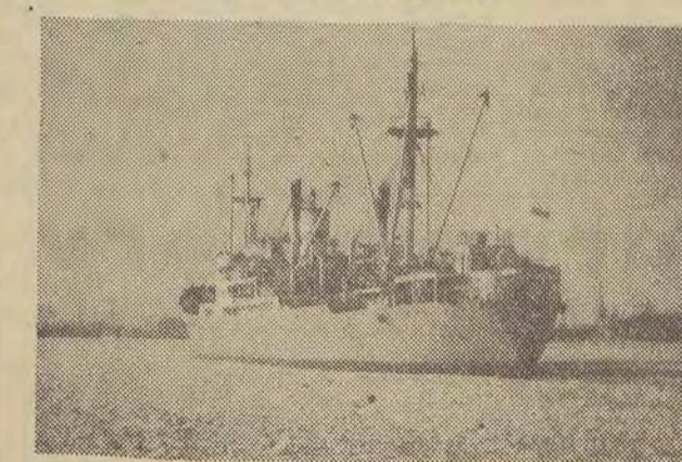
Różnego rodzaju lody — stałe, świeże, dryfujące, luźne lub zwarte — zalegają około 350 tysięcy kilometrów kwadratowych powierzchni Bałtyku. Na Zatoce Gdańskiej żegluga jest utrudniona. Aby utrzymać żeglugę z Gdyni w kierunku Helu w zwartych lodach lodolamacze i holowniki wylamały rynnę. Na zdjęciu: statek „Małgorzata Fornalska” wchodzi do portu w Gdyni.

PARYŻ (PAP). — Związki zawodowe zadowolone z wyniku pierwszego dnia strajku górników we Francji. Górnicy, zwłaszcza ci, którzy pracują pod ziemią, odpowiedzieli prawie w stu procentach na apel związków zawodowych i przerwali pracę nie dając się zastraszyć dyktetem o mobilizacji strajkujących.