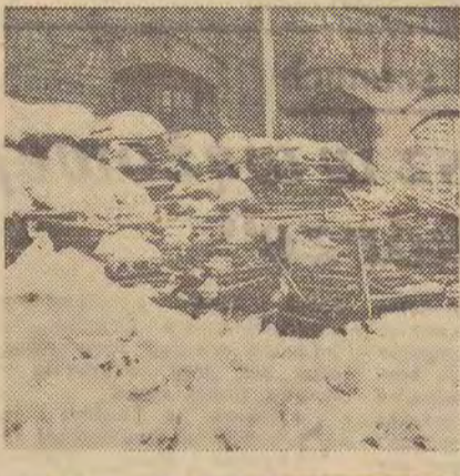
Stos żelaznych łózek rzuconych na pastwę losu. Przez całą zimę nikt nie zatroszczył się, aby zabezpieczyć je przed zniszczeniem. Ten „kwiatek” zastaliśmy na dziedzińcu Warsztatów Technicznych Zasadniczej Szkoły Łączności przy ul. Wołczańskiej nr 125. (J. Kr.)