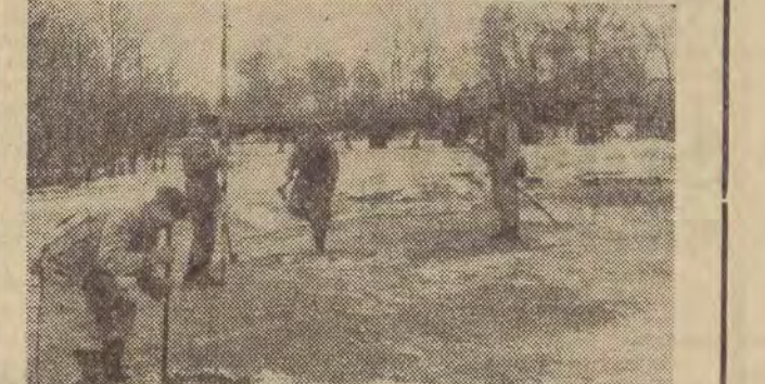
Saperzy zakładają ładunki wybuchowe, by skruszyć lód i ułatwić krze spłynięcie.