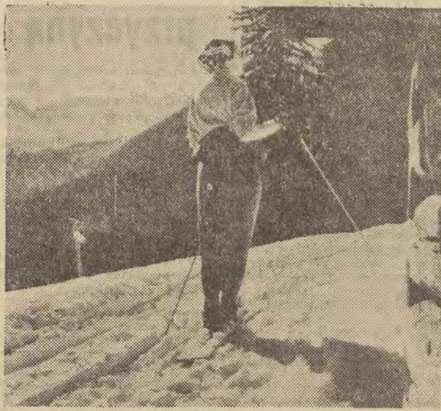
Widok z Rusinowej na Tatry po słowackiej stronie.