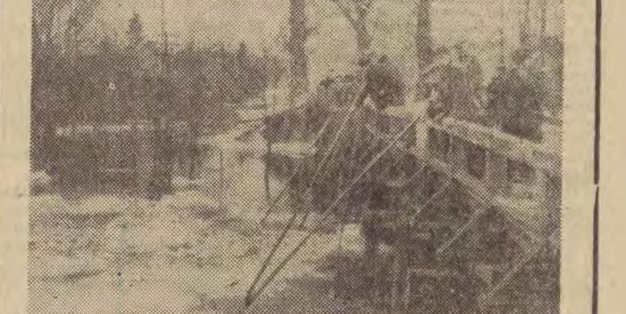
Mieszkańcy gromady Rogoźno nieustannie czuwają nad splotem kry pod mostem drewnianym.

Przy wszystkich zagrożonych obiektach, czuwają nieustannie przedstawiciele komitetów przeciwpowodziowych oraz oddziały wojskowe. Wczoraj żołnierze przeprowadzili dokładny patrol samolotowy wzdłuż całego koryta Warty w granicach woj. łódzkiego. W południowych odcinkach — od Działoszyna do miejscowości Ganiek, rzeka uwolniła się już z lodu i wody spokojnie spływają. Na odcinku północnym rzeki, w kierunku Rychnowa, Buzzenina, Osjakowa i Sieradza, Warta wciąż jeszcze stoi skuta lodem. W tym rejonie ruszenie grubej, dochodzącej do 90 cm pokrywy lodowej, może stać się w najbliższych dniach bardzo kłopotliwe. M. Kr.