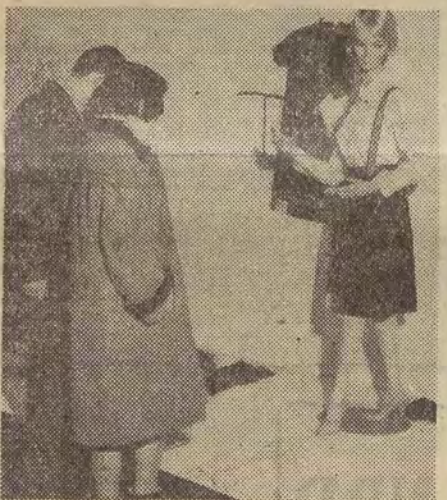
(Dalszy ciąg na str. 2)

Zbliża się kulminacyjny okres Krajowych Targów w Poznaniu — „Wiosna-63”. Na coraz większej ilości towarów pojawiają się wywieszki: „sprzedany” albo „tym ekspozycją Centrala Handlu Zagranicznego”. Tu wypada poinformować, że na targach działa aż 16 central eksportowych. Zawarły one już nawet kilka transakcji z zagranicznymi odbiorcami, którzy odwiedzili targi.