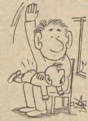
Zobaczmy jaka będzie minie kiedy napiszę do „Czerwonej Skrzyńki”, że się złączę nad starszymi!

Ponadto skrzyńki znajdują się w Urzędzie Pocztowo-Telekomunikacyjnym Łódź 1 (ul. Tuwima 38)