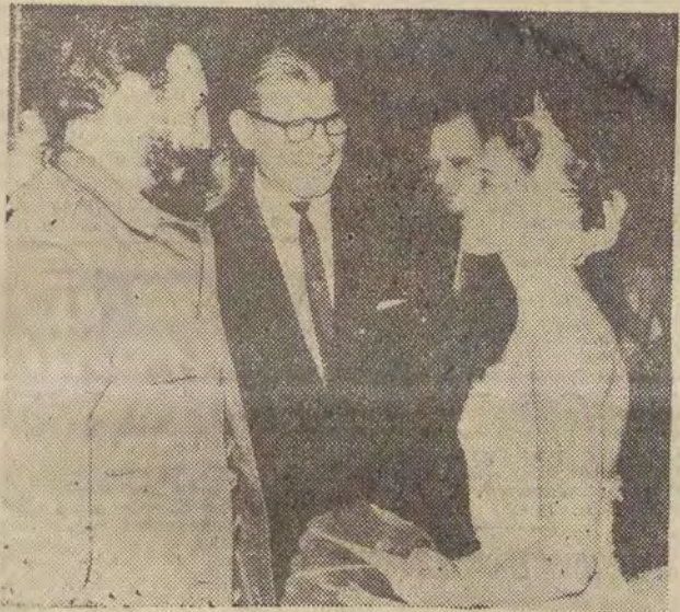
Fidel Castro obecny był 29.IV. na balecie Czajkowskiego „Jeziorko labędzie” w Wielkim Teatrze Opery i Baletu w Moskwie. Na zdjęciu: premier Kuby rozmawia podczas antraktu z primabaleriną Mają Pliśnicką.

Premier rewolucyjnego rządu Republiki Kubańskiej Fidel Castro Ruz obecny był w dniu 2 maja wraz z przewodniczącym Rady Ministrów ZSRR, N. S. Chruszczowem na uroczystości otwarcia letniego sezonu sportowego na Stadionie im. Lenina w Łodzi. Przeszło 100 tys. osób obecnych na stadionie zgromadziło N. S. Chruszczowa i Fidela Castro serdeczną owację. Tego samego dnia Fidel Castro i towarzyszące mu osoby obecni byli na koncercie świątecznym w Pałacu Zjazdowym na Kremle. 6 tys. moskwiczam zgromadzonych na sali zgotowała bohaterowi narodowemu Kuby owacje, która trwała kilka minut.