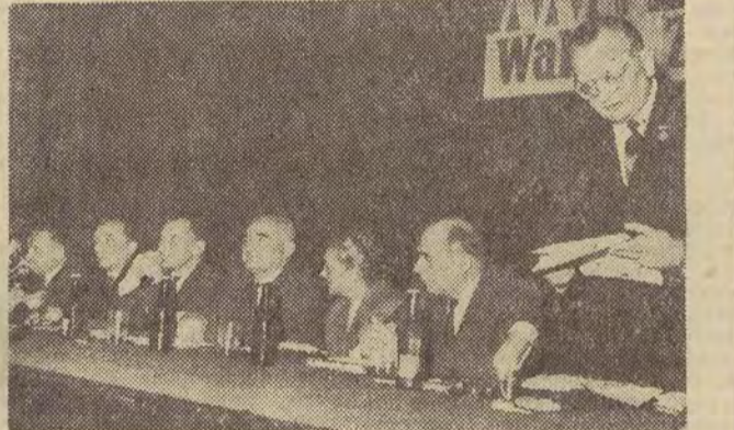
Na zdjęciu: fragment prezydium walnego zjazdu SIMP.