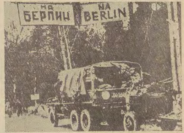
Na zdjęciu: rok 1945 — oddział Wojska Polskiego w drodze na Berlin... (Artykuł pt. „Gdy wstawał Dzień Zwycięstwa“ — zamieszczamy na str. 3).