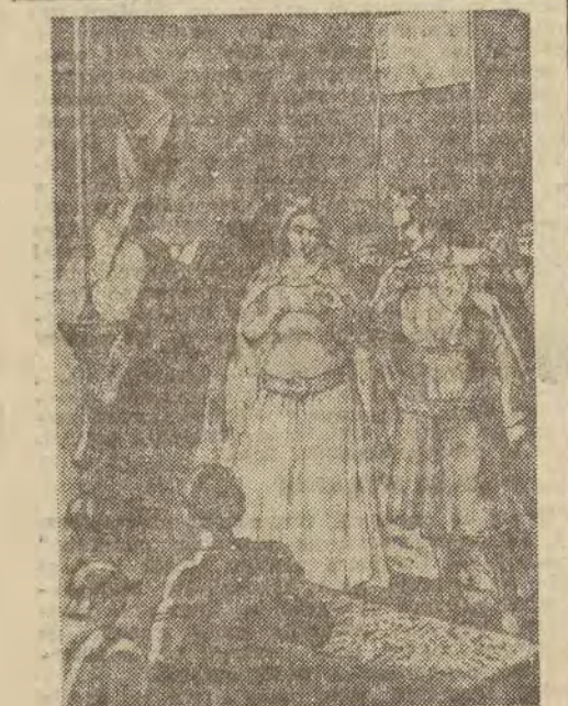
Ślub Jadwigi z Jagiełłą 1386 r.

„Król jest synem Olgierda, księcia litewskiego, nazwiskiem Jagiełło, zrodzony z Marią, córki księcia tatarskiego..."