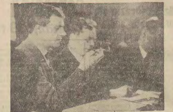
W. Majakowski na posiedzeniu redakcji wydawnictwa „Gosi-zdat” w 1928 r.