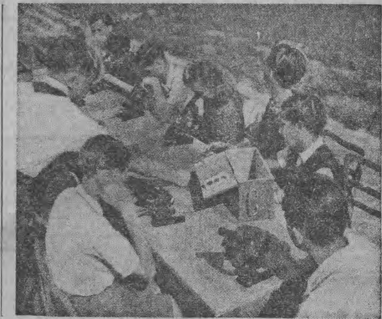
W zupełnie innym duchu wychowuje się młodzież w NRD. Miejsce rozbrzmiewających pruską komendą obozów młodzieży hitlerowskiej, zajęte tętniące radością życia obozy pionierów i F. D. J. Na zdjęciu świat roślin oglądany przez mikroskop odkrywa przed młodymi botanikami tajemnice natury.

Nemiecka Republika Demokratyczna stała się nie tylko potężną zapórą na drodze ponownej faszyzacji Niemiec i planu imperialistycznego pochodu wojennego na wschód. Przykład NRD i