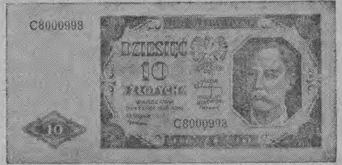
Nowe banknoty (w zmniejszeniu)