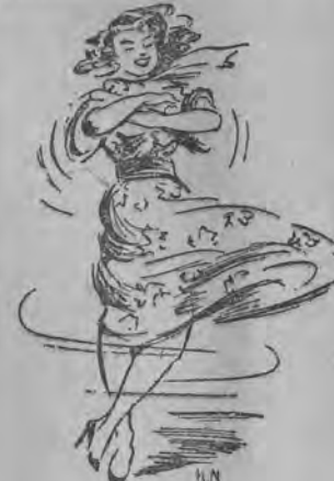
— „I puściła się w pias... w podskokach błyskała oczyma i śmiała się wesoło...”

„To dopiero wariatka!” — pomyślała Olga, porwana mimo woli jej wspaniałym, pełnym temperamentu tańcem.