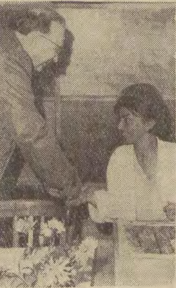
Na zdjęciach: ambasador K. Mewis w Zakładach im. Marchlewskiego.