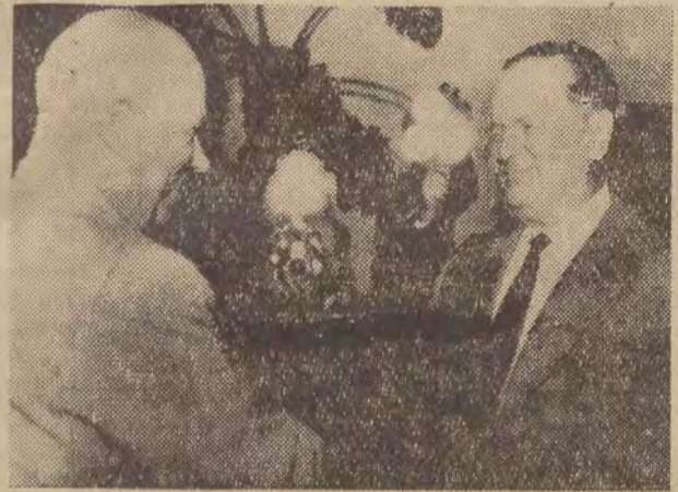
Na zdjęciu: N. S. Chruszczow i J. Broz-Tito na wyspie Brioni.

W środę wieczorem przewodniczący Rady Ministrów ZSRR Nikita Chruszczow i prezydent SFRJ Józef Broz-Tito