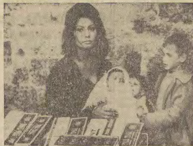
„Wczoraj, dziś, jutro” to nowy film reżyserii Vittorio de Sica, w którym główną rolę gra Sophia Loren. Na zdjęciu: scena z filmu.