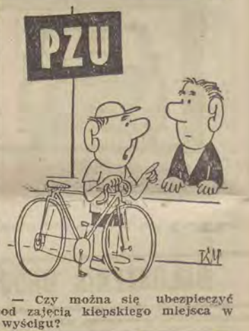
— Czy można się ubezpieczyć od zajęcia kiepskiego miejsca w wyciągu?