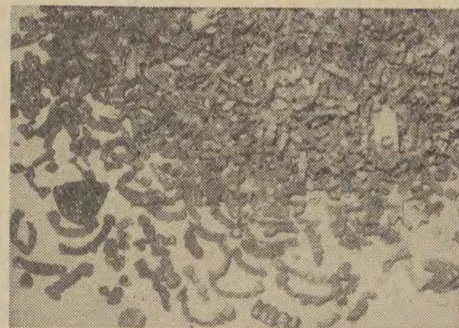
Nadpalone i osmalone płomieniami szczątki ludzkich protez i zęby.

Między delegacjami ZSRR i Afganistanu podpisane zostało porozumienie w sprawie udzielenia Afganistanowi pomocy technicznej w budowie urządzeń atomowych. Związek Radziecki zorganizuje w Afganistanie laboratorium fizyczne dla celów naukowych i stworzy niezbędne warunki dla przygotowania specjalistów afgańskich w dziedzinie zastosowania energii atomowej do celów pokojowych.