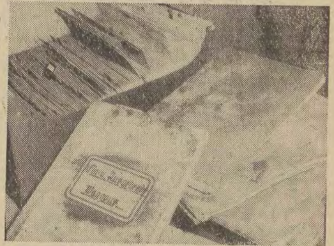
Odnalezione książki i kartoteka łódzkiego Gettoverwaltung.

Porządkując piwnice, pracownicy Kuratorium natknęli się, w zagraconym kącie, na tajemniczą walizkę, stos dużego formatu książek oraz kartotekę. Przy bliższych oględzinach okazało się, że są to, nie znane dotąd, pozostałości zarządu łódzkiego getta.