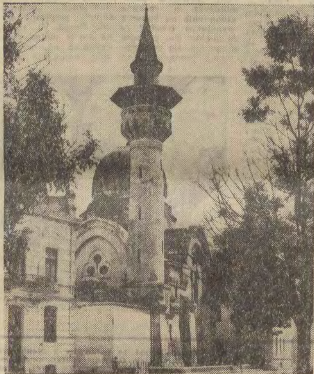
Na zdjęciu: stary turecki meczet w Konstancy.